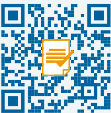
AEMET: Predicción inmediata

Permite realizar predicciones en las zonas específicas en las cuales se disponga de estaciones meteorológicas que aporten datos al modelo predictivo.